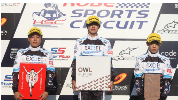
DUNLOP NEXT CUP EXGEL 神戸シリーズ第3戦

今回はセッティングも合わせることができ優勝できました。決勝の展開はほぼ作戦通りにできたと思います。中盤以降は少し余裕をもって走ることができました。次回も今日のような走りでも優勝したいと思います。